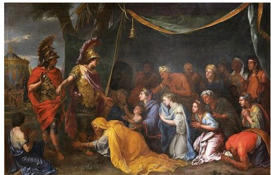
FIGURA 113. Charles Le Brun, Las reinas de Persia a los pies de Alejandro , 1660-61, óleo sobre lienzo, 298x453 cm, Château de Versailles, Versailles