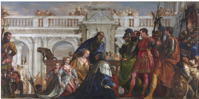
FIGURA 112. Paolo Veronese, La familia de Darío ante Alejandro , 1565-67, óleo sobre lienzo, 236,2x474,9 cm, The National Gallery, Londres

En 1635 la pintura fue registrada como propiedad de Víctor Amadeo I, duque de Saboya, en su residencia en Turín. Poco después fue regalado al mariscal duque Charles I de Créquy, adquirida a su muerte por cardenal de Richelieu, que lo legó al rey Louis XIII junto con su Palais-Cardinal . Más tarde se trasladó sucesivamente al Palais de Fontainebleau, al Palais des Tulleries y al Château de Versailles por el rey Louis XIV, llegando a tener una excelente reputación en el seno de la colección real. “En 1660-61 a petición del rey, Charles Le Brun pintó Las reinas de Persia a los pies de Alejandro [fig. 113], que sería instalado en 1668 como pareja de los Peregrinos de Emaús de Veronese, con el fin de encarnar la supremacía francesa en el terreno de la pintura de historia frente a uno de los más bellos ejemplos del arte italiano. Es probable que Le Brun conociera que Veronese ya había abordado ese mismo tema, ya que el embajador de Francia en Venecia, había intentado adquirir, entre 1662 y 1665, La Familia de Darío ante Alejandro [fig. 112] para el rey” 181 . En la actualidad, Los peregrinos de Emaús se encuentra colgado en la misma sala 711, Salle des Etats , que las Bodas de Caná , del Musée du Louvre.