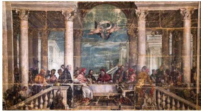
FIGURA 118. Paolo Veronese, Cena en casa de Gregorio Magno , 1572, óleo sobre lienzo, 468x861 cm, refectorio del santuario de Santa Maria di Monte Berico, Vicenza

Entre octubre de 2019 y junio de 2022, se realizó una profunda restauración de la obra que además de restituir la gama cromática original, permite observar, después de su decapado, el estado de la obra con las costuras de los 32 pedazos, sobre todo en la parte inferior, en los que se desgarró en 1848 [fig. 118].