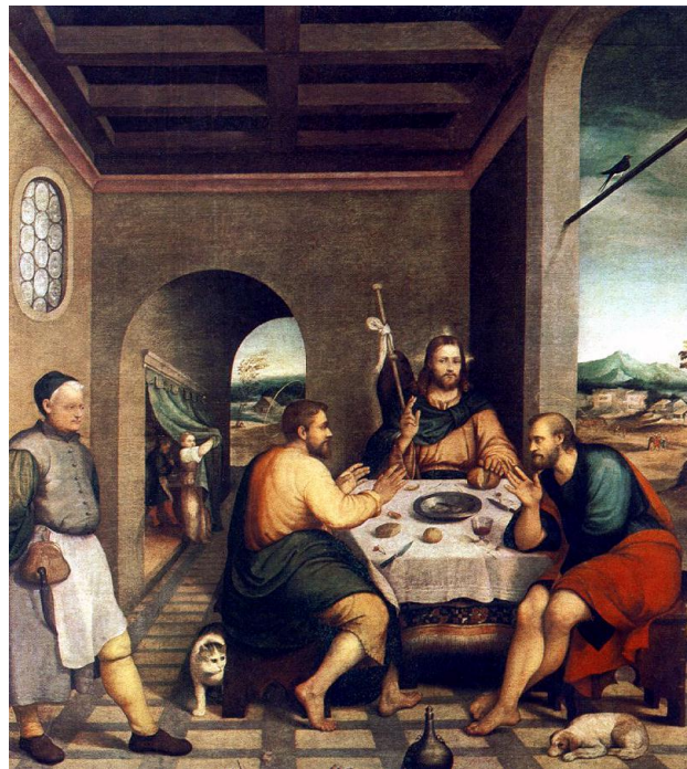
FIGURA 116. Jacopo Bassano, Cena de Emaús , 1537, óleo sobre lienzo, 250x235 cm, catedral de Cittadella, Cittadella

En agosto de 1537 Pietro Cauzio, arcipreste de la catedral de Cittadella, encargó a Jacopo Bassano realizar algunos frescos y un “retablo con la historia de Lucas y Cleofás”, la Cena de Emaús [fig. 116], para decorar el presbiterio tras la reforma del edificio.