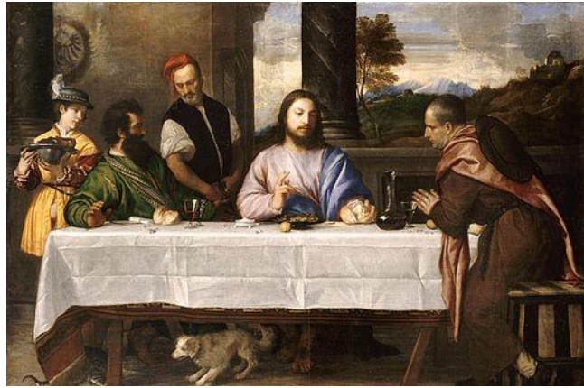
FIGURA 115. Tiziano, Los peregrinos de Emaús , 1533-34, óleo sobre lienzo, 169x244 cm, Musée du Louvre, París

En agosto de 1537 Pietro Cauzio, arcipreste de la catedral de Cittadella, encargó a Jacopo Bassano realizar algunos frescos y un “retablo con la historia de Lucas y Cleofás”, la Cena de Emaús [fig. 116], para decorar el presbiterio tras la reforma del edificio.