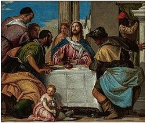
FIGURA 114. Paolo Veronese, Cena de Emaús , 1565-70, óleo sobre lienzo, 68,3x80,7 cm, Collection Museum Boijmans Van Beuningen, Róterdam