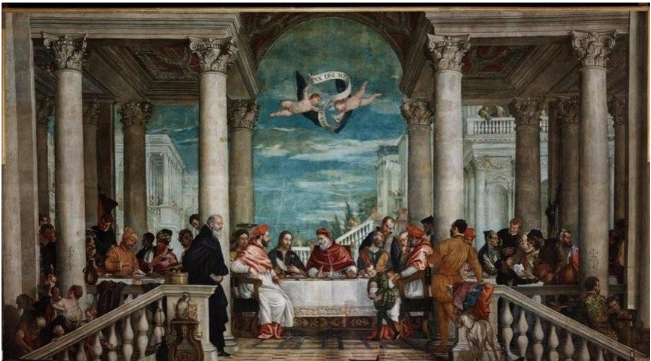
FIGURA 117. Paolo Veronese, Cena en casa de Gregorio Magno , 1572, óleo sobre lienzo, 468x861 cm, refectorio del santuario de Santa Maria di Monte Berico, Vicenza

La Cena en casa de Gregorio Magno [fig. 117], es una obra de Veronese de 1572 (por la que consta un pago del 29 de abril), que adorna la pared trasera del antiguo refectorio del Santuario de Santa Maria di Monte Berico, lugar de culto custodiado por la orden de Servi di Maria, asentados desde 1435 en Monte Berico, y destino de culto mariano ininterrumpido desde 1426, cuando tuvo lugar aquí una aparición de la Virgen, en un contexto de peste en la ciudad de Vicenza. La pintura, es de grandes dimensiones, 468x861 cm, con un total de unos 39 metros cuadrados. Es la única Cena de Veronese que aún se conserva en su ubicación original, y representa el tema de la caridad y generosidad hospitalaria, plasmado en la entrega de comida a los pobres, como símbolo visual del ideal cristiano de caridad, hospitalidad y amor al prójimo, según lo narrado en La leyenda dorada 183 , donde se dice que el papa Gregorio Magno invitó a doce peregrinos a su mesa y, para su sorpresa, descubrió en uno de ellos la presencia del propio Cristo. La escena, estructurada en un entorno con coordenadas palladianas, con un efectivo juego teatral, se centra precisamente en el momento de la revelación divina.