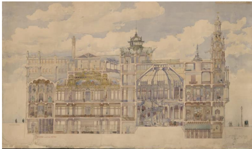
Sección del Casino de Madrid diseñada por Antonio Palacios, 1903 Exposición "Madrid Metrópoli"

Intentaremos responder a la pregunta: ¿Quién fue Antonio Palacios? Nacido en el pequeño pueblo pontevedrés de Porriño, muy cerca de la ribera del Miño, como el genial Miguel Ángel creció a la "sombra de las canteras", las grandes moles de piedra granítica rosa de la comarca de Louriña. Su procedencia, unida al conocimiento de la arquitectura histórica de Galicia y a su formación de arquitecto en Madrid darían lugar a un hombre genial.