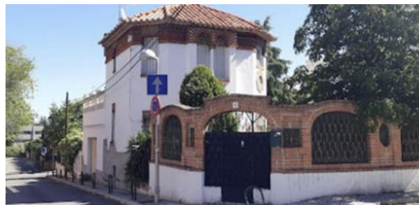
Casa de Antonio Palacios en el Plantío Aravaca.

Finalmente muere en una humilde casa diseñada por él mismo, ubicada en El Plantío , perteneciente hoy día al distrito madrileño de Aravaca y es enterrado en el cementerio de San Lorenzo de Madrid.