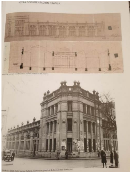
Proyecto y Talleres del ICAI sobre 1936

El año 2024 se cumplieron 150 años del nacimiento de un hombre genial, que vivió para su obra y cuya figura se agranda a medida que pasa el tiempo y es más conocido de todos: el arquitecto Antonio Palacios Ramilo .