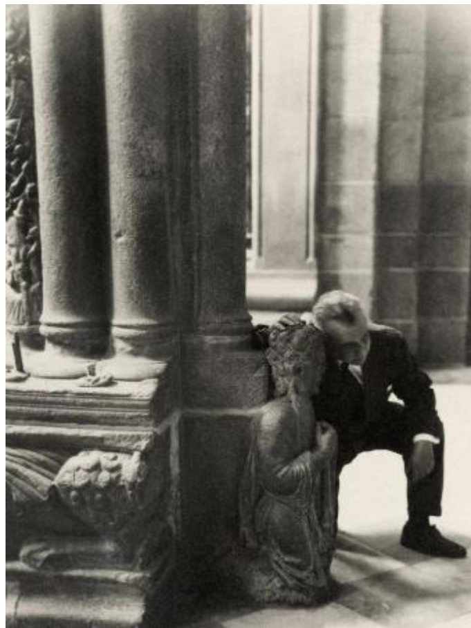
Antonio Palacios y "el santo dos croques" en la Catedral de Santiago