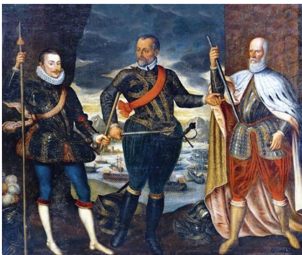
De izq. a derecha: D. Juan De Austria, Marco Antonio Colonna y Vernier.

Qué duda cabe que Lepanto fue una de las batallas navales más importantes de nuestra historia y de la historia universal. La historia de Europa y la de nuestro mundo hubieran sido completamente diferentes si la balanza se hubiera inclinado hacia el lado turco.