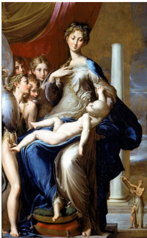
Parmigianino. Virgen con el cuello largo, 1534

Cuadro representativo del manierismo. Rompe con la armonía de la composición (amontona a los ángeles a un lado). Proporciones anatómicas raras, cuello largo, dedos largos (es la época del Greco). El artista exhibe su manera ("manera") de pintar; algunos como los grandes artistas (Miguel Ángel, Leonardo o Rafael) otros intentando romper con lo establecido.