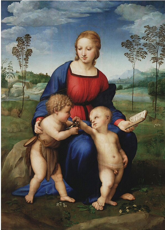
Rafael Sanzio. La Virgen del Jilguero (Maddona del Cardellino), 1506.

La Virgen con el Niño y San Juanito. La composición en triángulo que sugiere equilibrio.