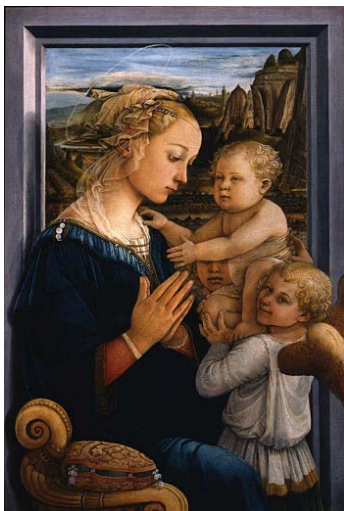
Filippo Lippi (1406-1469). Virgen con el Niño y dos ángeles.

Piero della Francesca escribe un tratado de matemáticas; en la corte del duque de Urbino existen el concepto gótico y la ciencia)