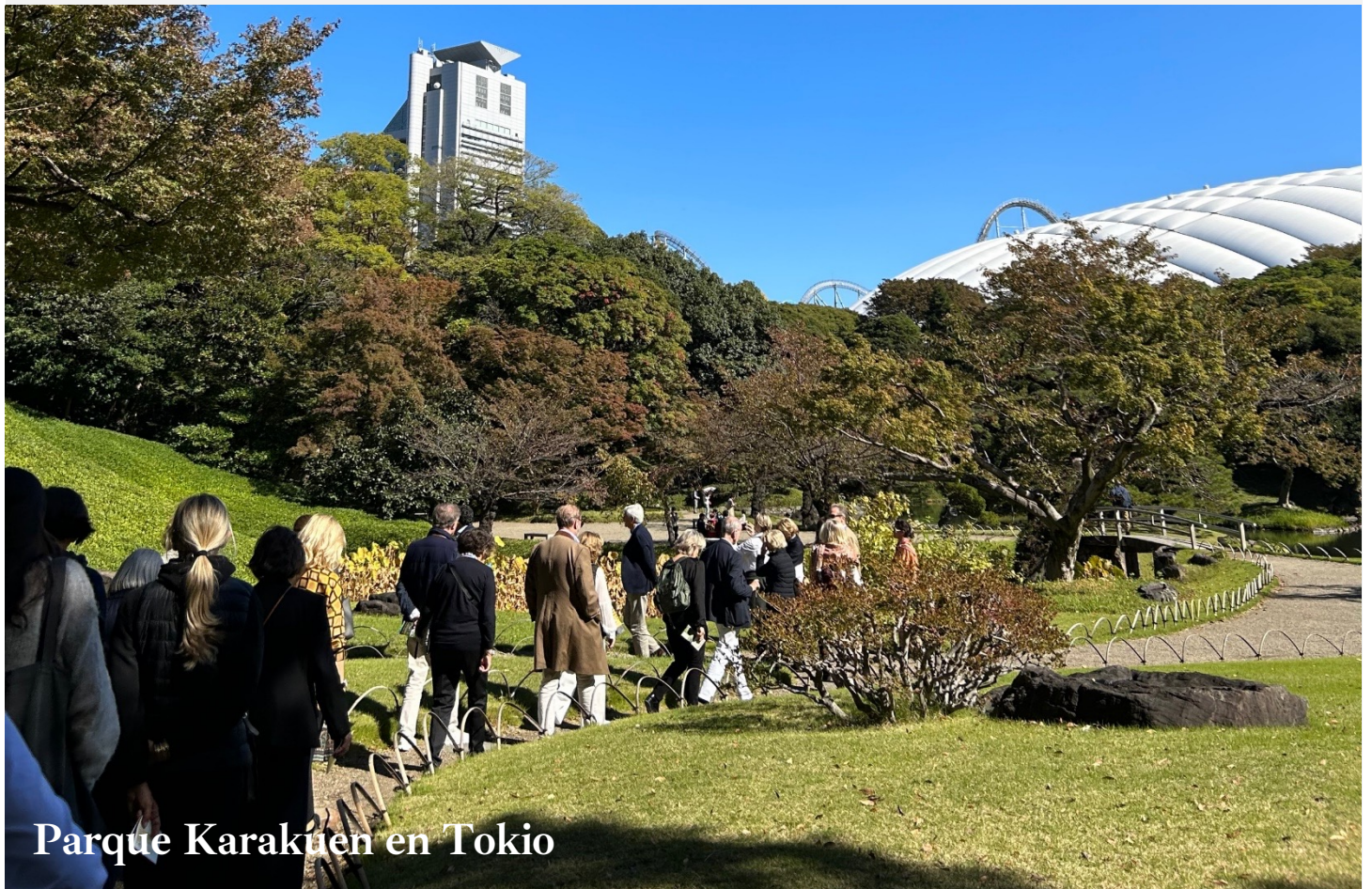
Parque Karakuen en Tokio

Es un programa muy cuidado sólo para los alumnos de Youtopía . Espero te guste y nos acompañes.