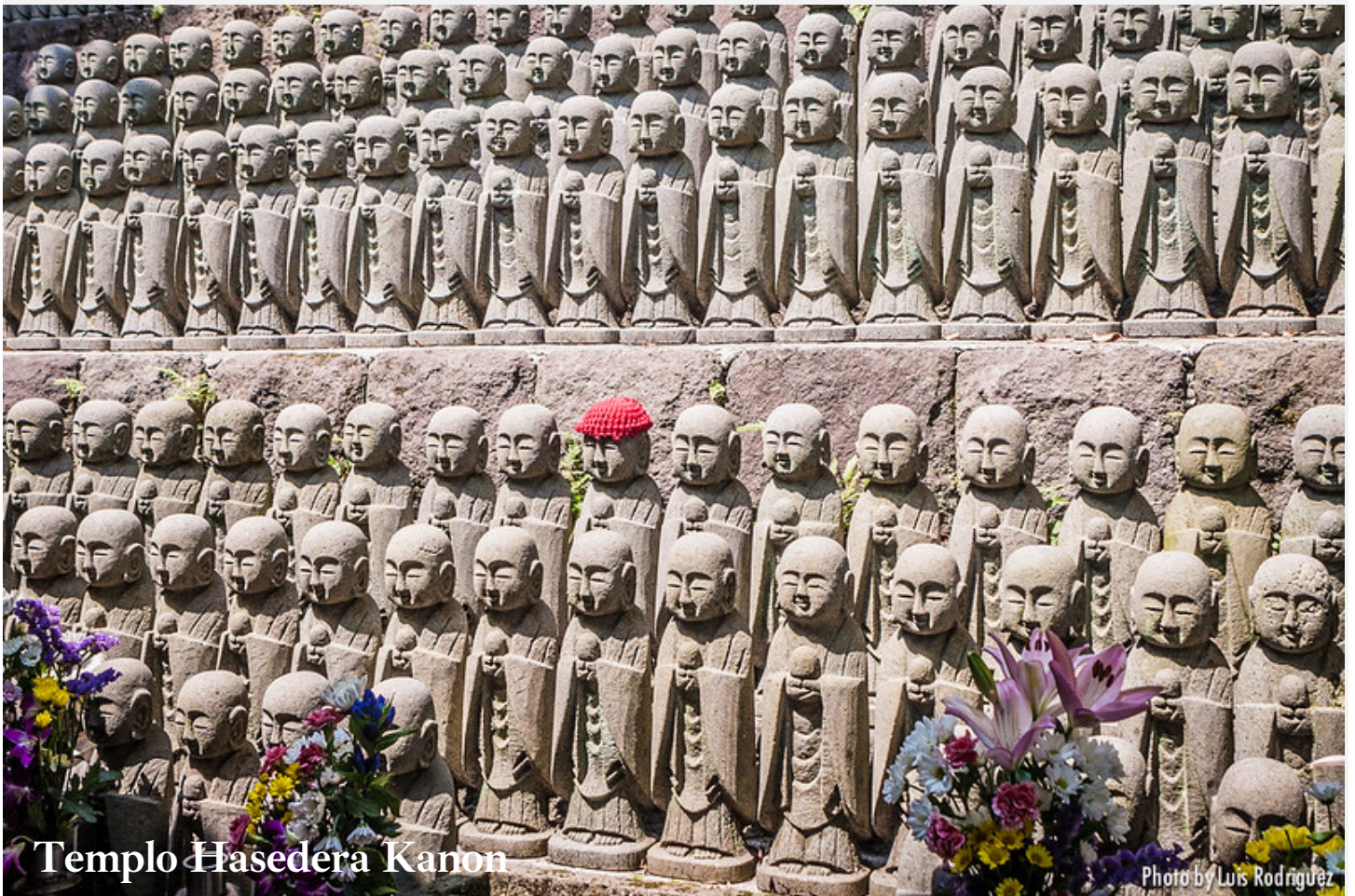
Templo Hasedera Kanon

Veremos el Gran Buda de bronce , superviviente único del tsunami que arrasó la ciudad en el siglo XV. Seguiremos con el Templo Hasedera Kanon , famoso por la mística estatua de madera de Kannon , deidad femenina budista. Al terminar llegaremos al Santuario Shintoísta de Tsurugaoka Hachimangu , construido hace mil años y donde reside el espíritu de Hachiman , dios de los guerreros según el rito sintoísta.