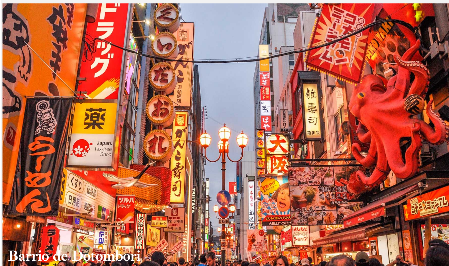
Barrio de Dotombori.

Terminaremos con uno de los enclaves históricos mas monumentales de Japón, las tumbas de Mozu . Complejo de montículos de los siglos IV-VI que servían como lugar de sepultura durante el periodo Kofun.