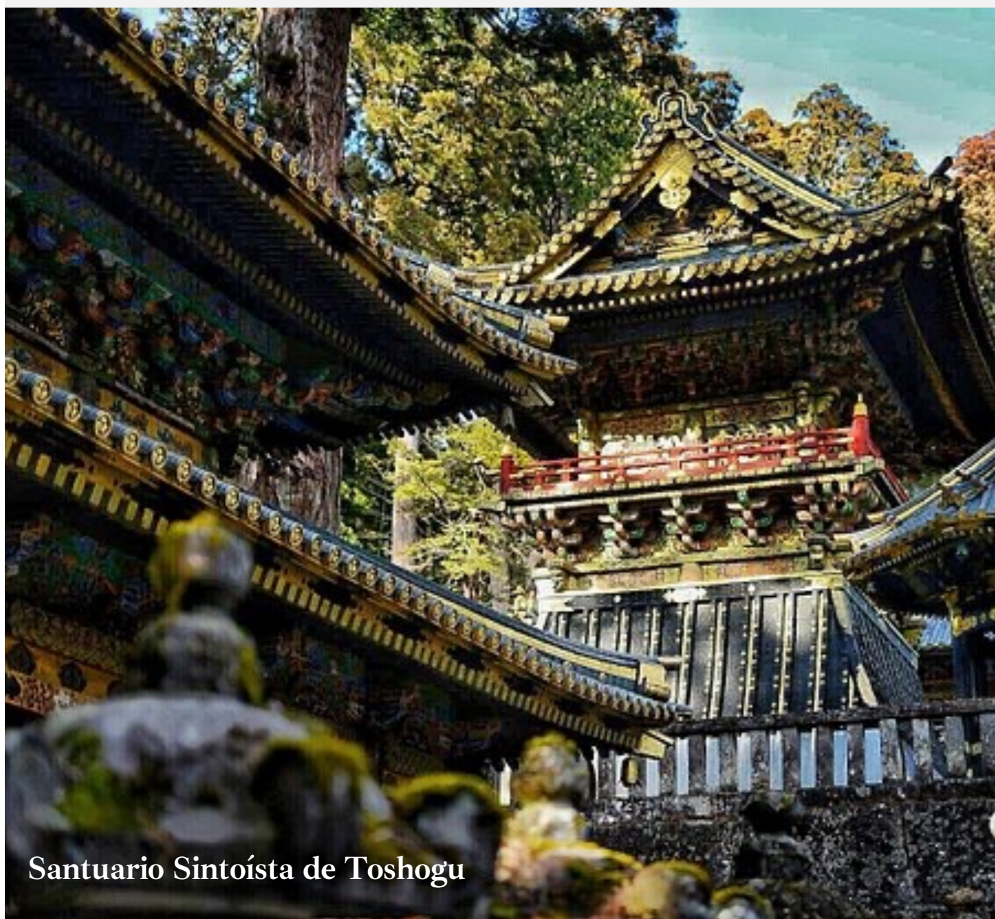
Santuario Sintoísta de Toshogu

Veremos el Santuario Sintoísta de Toshogu rodeado de una característica naturaleza japonesa y de ahí llegaremos al Lago Chuzenji y veremos su Cascada Kegon , monumento natural del país.