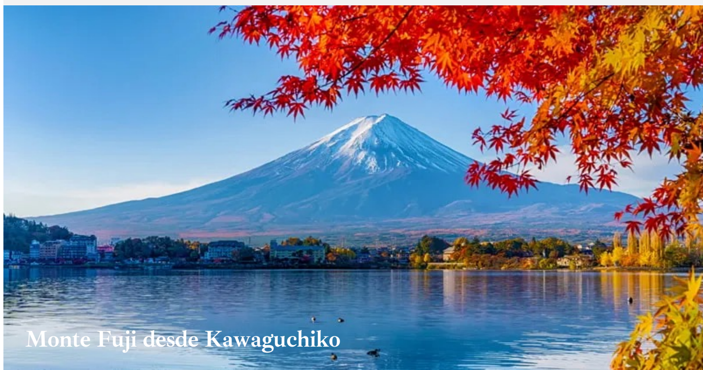
Monte Fuji desde Kawaguchiko

Después del almuerzo nos trasladaremos a un Ryokan (hotel), tradicional alojamiento japonés con el que poder experimentar de primera mano la historia y tradición de este país. Disfrutaremos en grupo de una cena tradicional japonesa.