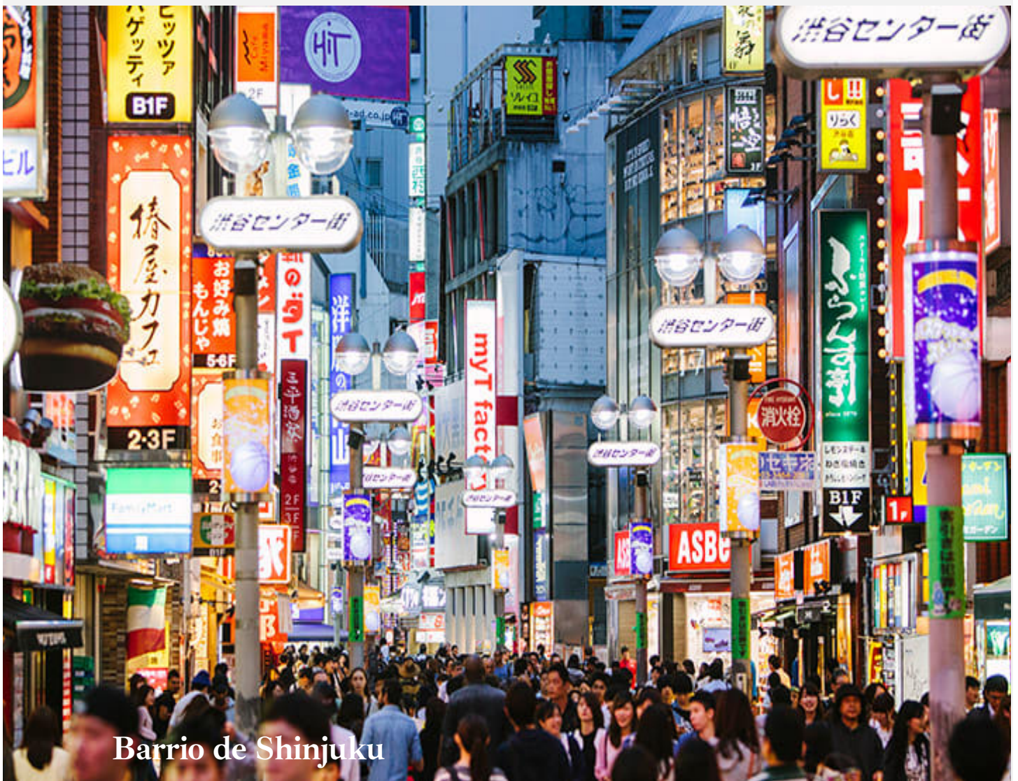
Barrio de Shinjuku

Empezamos con el barrio Shinjuku , centro neurálgico de la vida moderna en la ciudad hasta llegar al Parque Ueno y al Museo Nacional de Tokyo , el más antiguo y grande del país.