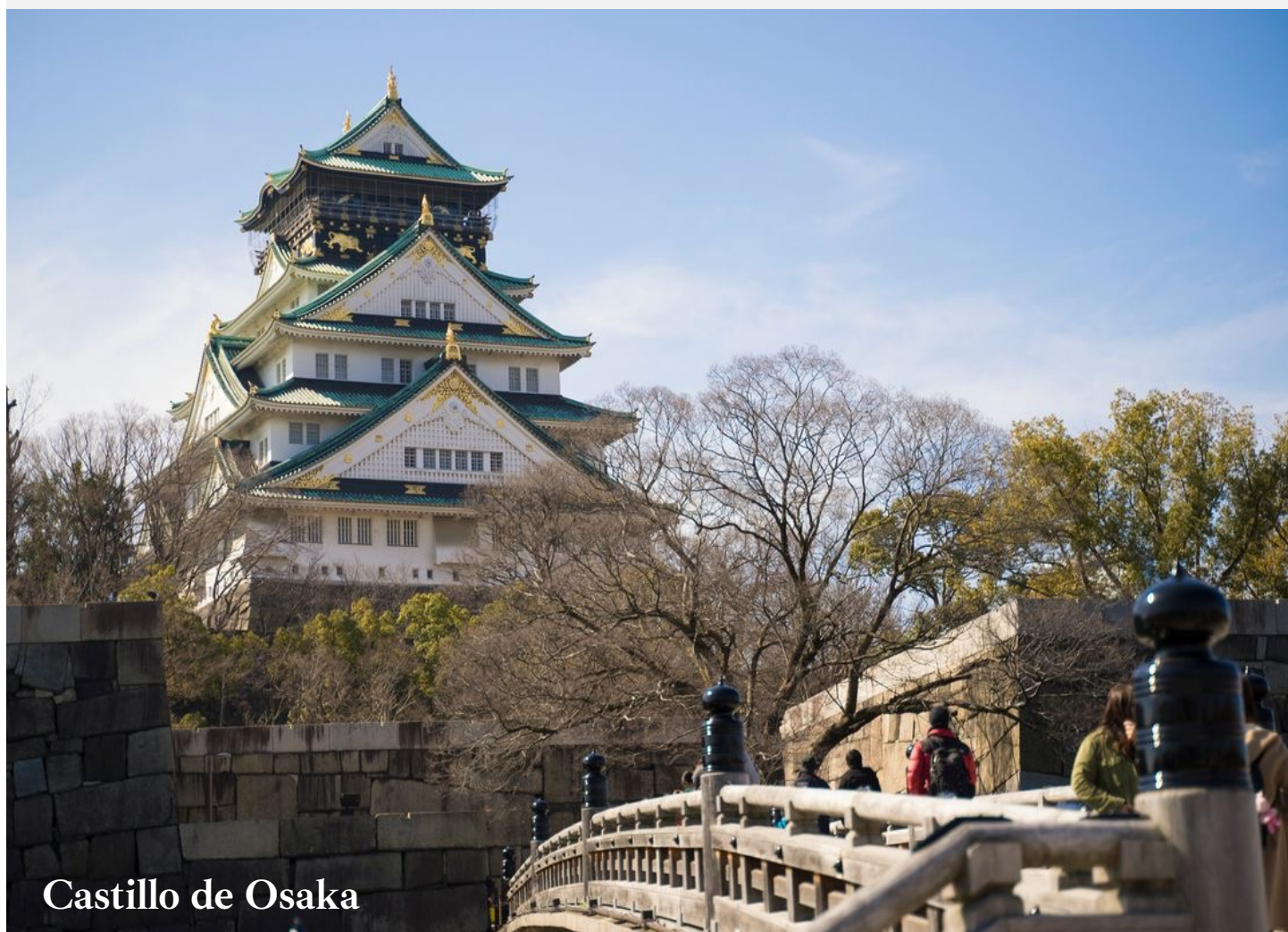
Castillo de Osaka

Nos trasladaremos al Hotel en transporte privado. Después del check in tendremos tiempo para descansar tras el largo viaje y aclimatarnos al nuevo horario y tiempo.