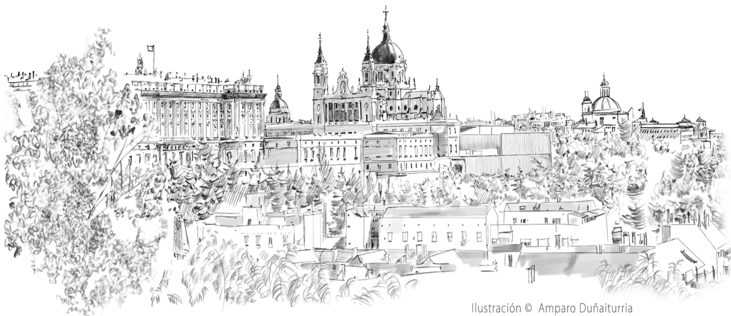
Ilustración © Amparo Duñaiturria

Diferencia y particularidades de Madrid respecto a otras ciudades Trazado urbanístico, calles y plazas ¿Qué conservamos de nuestro pasado?