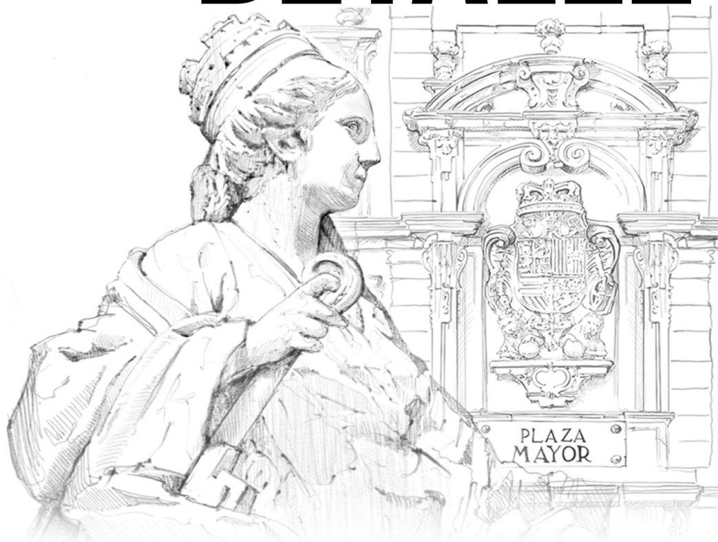
Ilustración © Amparo Duñaiturria

“Paisaje de las Artes y las Ciencias” Edificios y esculturas más destacadas y su simbología